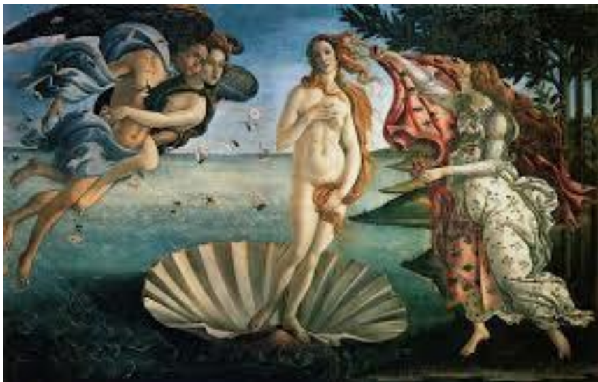
Sandro Botticelli, El naixement de Venus , 1485-1486