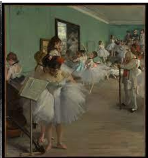
Louis-Jacques Mandé Daguerre, Natura morta (Taller de l'artista) , 1837 / Edgar Degas, La classe de ballet , 1871