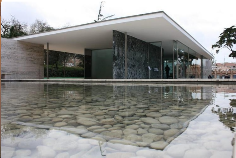
Mies van der Rohe, Pavelló de Barcelona, 1929

OPCIÓ B. A partir d'aquestes dues obres, relacionau els orígens de la fotografia amb la pintura impressionista.